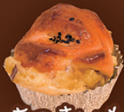
さつまいも のパン