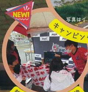
NEW! 親子でeスポーツ体験