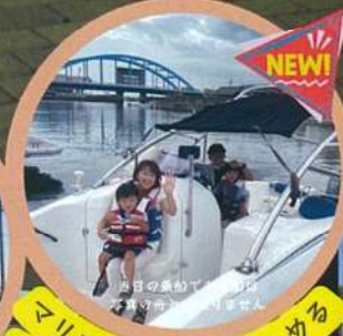
NEW! マリンスポーツも楽しめる