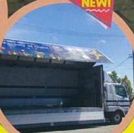
NEW! オープンマイクトラックステージ