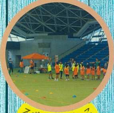
スポーツ鬼ごっこ