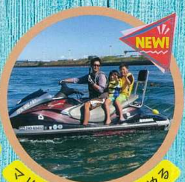
マリンスポーツも楽しむ