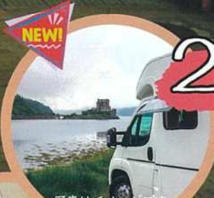
NEW! キャンピングカーの展示 写真はイメージです

四日市市制120周年市民企画イベントとしてスタートし、2023年に7回目の開催を迎えます。実行委員一同、ご来場いただく皆様楽しんでいただけるよう準備を進めております。詳細が決定するまで、もししばらくお待ちください。始まりは、四日市で盆踊りが大好きな人たちの「盆踊りをもっと踊りたい!」「四日市ドームだったら徹夜で踊れるんじゃないか?」という企画。たくさんの仲間たちで実行委員会を立ち上げ、2022年に6回目の開催となりました。「ダンス、音楽」「夜から朝まで続く盆踊り」「マルシェ」に加え、6回目から新たに「制作体験」「ロゲイニング」を加えてパワーアップ!!「工場夜景の町・眠らない街四日市」で行なう29時間ぶっ通しイベントです。※四日市徹夜踊りの祭典「よんてつ」は皆様の協賛・協力で運営しております。