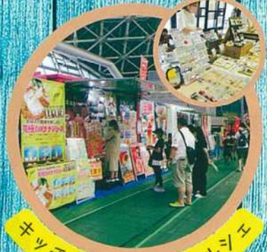
キッチンカー&プチマルシェ