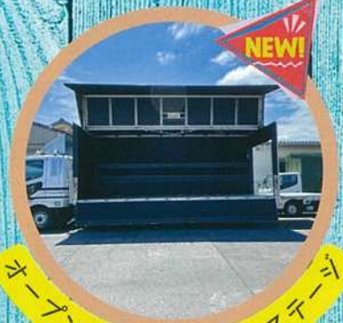
オープンマイクトラックステージ