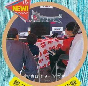
親子でレスポーツ体験