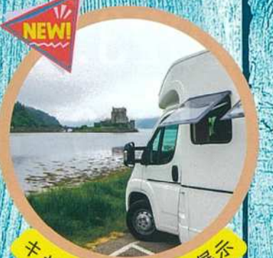
キャンピングカーの展示