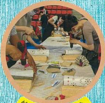
竹あかり制作体験